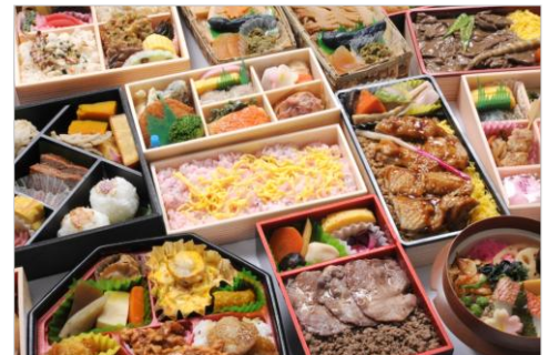
販売商品イメージ