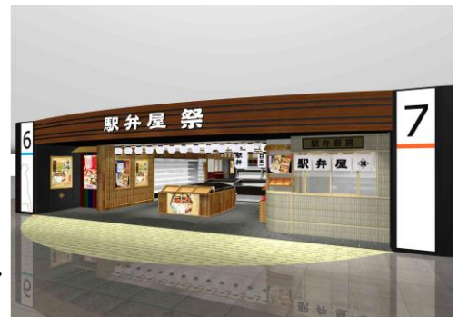
店舗外観イメージ

お父さんが出張のお土産に持ち帰ってくれた駅弁、家族旅行の車中で舌鼓を打った駅弁、友人から旅行の名産土産に贈られた駅弁など、お客さまの心に残る一品やあの人にもお勧めしたい満足の逸品を全国津々浦々の駅弁の中から「探して、比べて、発見して」いただける「駅弁屋 祭」をお楽しみ下さい。