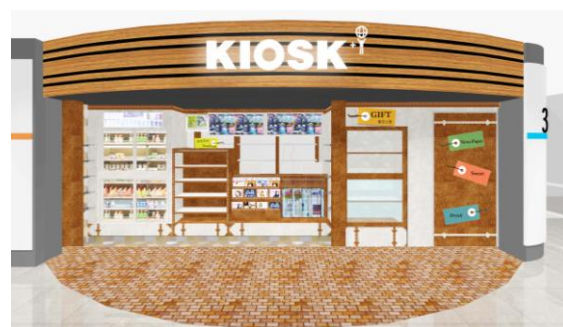
店舗外観イメージ

店舗デザインは、出張・旅行などの東京駅のご利用シーンから「旅行かばん」をモチーフにしています。かばんの中に入っていたら「便利」で「楽しく」なるものがギュッと詰まっているショップをイメージし、「いらっしゃいませ」と「いってらっしゃいませ」の気持ちを表現しました。