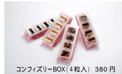
コンフィズリー-BOX(4粒入) 380円

カンロ飴やピュレグミでおなじみのカンロのコンフィズリー(砂糖菓子)ショップ。いつもと違うヒトツブのコンフィズリーを通して、自分で楽しんだり大切な人と分け合えるデイリーな幸せをお届けします。