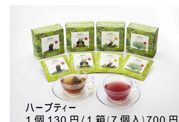
ハーブティー 1個130円/1箱(7個入)700円

「ハーブをもっと身近にしよう!」という想いから生まれたエスビー食品のハーブショップ。たくさんの動物たちを通してハーブの楽しみ方をご紹介します。90種類以上のハーブティー等に加え、東京駅限定カレルウなど、自分で楽しむのはもちろん、プレゼントにもぴったりのアイテムを揃えました。ハーブの香りで毎日の生活を楽しめます。