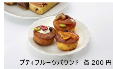
プティフルーツパウンド 各200円

インテリアショップのKEYUCAがプロデュースするパティスリー。「FELICE (フェリーチェ)」は幸せという意味。毎日でも買いたい飽きのこないプチサイズの焼き菓子のほか、オリジナル食器や雑貨などお菓子を組み合わせるとしてギフトとしてもご利用いただけます。