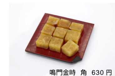
鳴門金時 角 630円

エキナカ初出店の新ブランド。みんなが大好きな「さつまいも」の中でも高級さつまいも「鳴門金時」を使ったお菓子の専門店です。「鳴門金時」を秘伝の糖蜜に漬け込み一口サイズにカットした「角」や鳴門金時の風味いっぱい芋餡を丁寧に焼き上げた「渦」などさつまいもファン垂涎の新食感スイーツです。