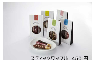
スティックワッフル 450円

ワッフルケーキ専門店エール・エルが焼き菓子に力を入れたお店。注目アイテムは初登場の「スティックワッフル」。華やかにデコレーションしたスティック状の新感覚ワッフルです。