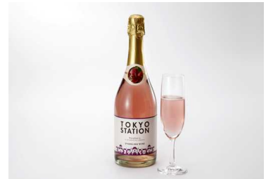
TOKYO STATION Weibel Raspberry Flavored California Sparkling Wine 1,500 円

泡をテーマにした新業態のドリンクの専門店。泡のドリンクやリカーを自由自在に組み合わせた、新しい「泡の楽しみ方」を提案いたします。常時数種類の泡のお酒を比較しながら楽しめるテイスティングコーナーも設けています。相性の良いおつまみやお菓子などもご用意、東京駅に新しいお気に入りの場所が見つかります。