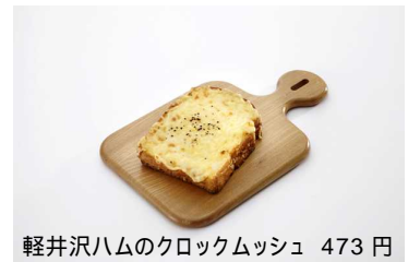
軽井沢ハムのクロックムッシュ 473 円

軽井沢に本店を構える老舗ベーカリー「浅野屋」。昭和初期より華族や諸外国の別荘族の方々に愛されたイギリスパンをグランスタ限定「軽井沢ロイヤルブレッド」として再現。軽井沢ロイヤルブレッドを使用したサンドイッチ、欧風惣菜パンなどワンハンドフードも豊富な品揃えです。