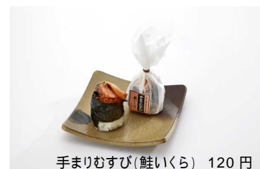
手まりむすび(鮭いくら) 120 円

こだわりの手作りおむすびを厳選素材でお届けする笹八がエキナカ初出店です。食べやすい一口サイズの創作おにぎり「手まりむすび」や「菓子結び」など、手軽に食べられる個性豊かな米飯が揃います。色々なものをお好みでチョイスでき、おやつやお土産に選ぶ楽しさが満載です。