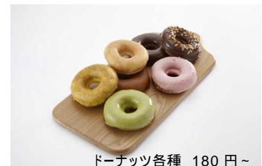
ドーナツ各種 180 円～

ベーグルでおなじみのBAGEL & BAGELがグランスタとの共同開発をしたドーナツを中心に、手軽に楽しめるワンハンドフードをご提供。新感覚の「バイクドーナツ」はしっとりモチリとした食感です。その他新提案のベーグルサンドも食べ応えのあるボリュームをご用意。