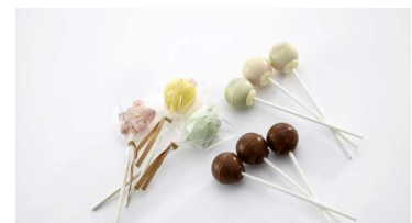
ロリポップチョコレート 1本 180円・300円

メリーチョコレートが手がけるチョコレート専門店。世界的なチョコレート展「サロン・ド・ショコラ パリ」で4ツ星に輝いたメリーチョコレートがいつものショッピングを楽しむマルシェのように、毎日立ち寄りたくなるチョコレートショップを新たにご提案します。