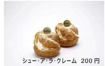
シュー・アラ・クレーム 200円

おなじみの銀座コースコーナーが様々なタイプのカスタードクリームを専門的に楽しめるショップを展開。シュークリームをメインに、特製カスタードクリームを使ったプリンも普段のおやつとしてはもちろん、おもたせやプチギフトにも活躍します。